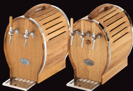
Robinet centrale non réfrigéré

Appareil livré avec robinets compensateurs et tuyauterie nécessaire